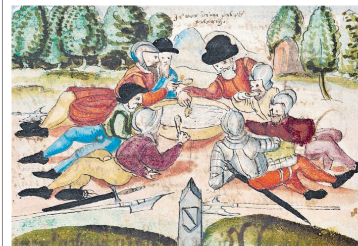
Friedliche Milchsuppe statt Gemetzel: Erster Kappelerkrieg.

Die Konflikte führten nicht zu einer Spaltung der Eidgenossenschaft, sondern zu einer territorialen Konfessionsordnung: Jeder Ort bestimmte seine Religion selbst, Minderheiten erhielten begrenzte Rechte. Die Eidgenossenschaft blieb formal bestehen, entwickelte aber eine Praxis der politischen Koexistenz. Die Erfahrungen dieser Konflikte prägten den Weg hin zum modernen Bundesstaat und zu einer Kultur, in der Differenz nicht zwangsläufig gewaltsam gelöst wird. TZ