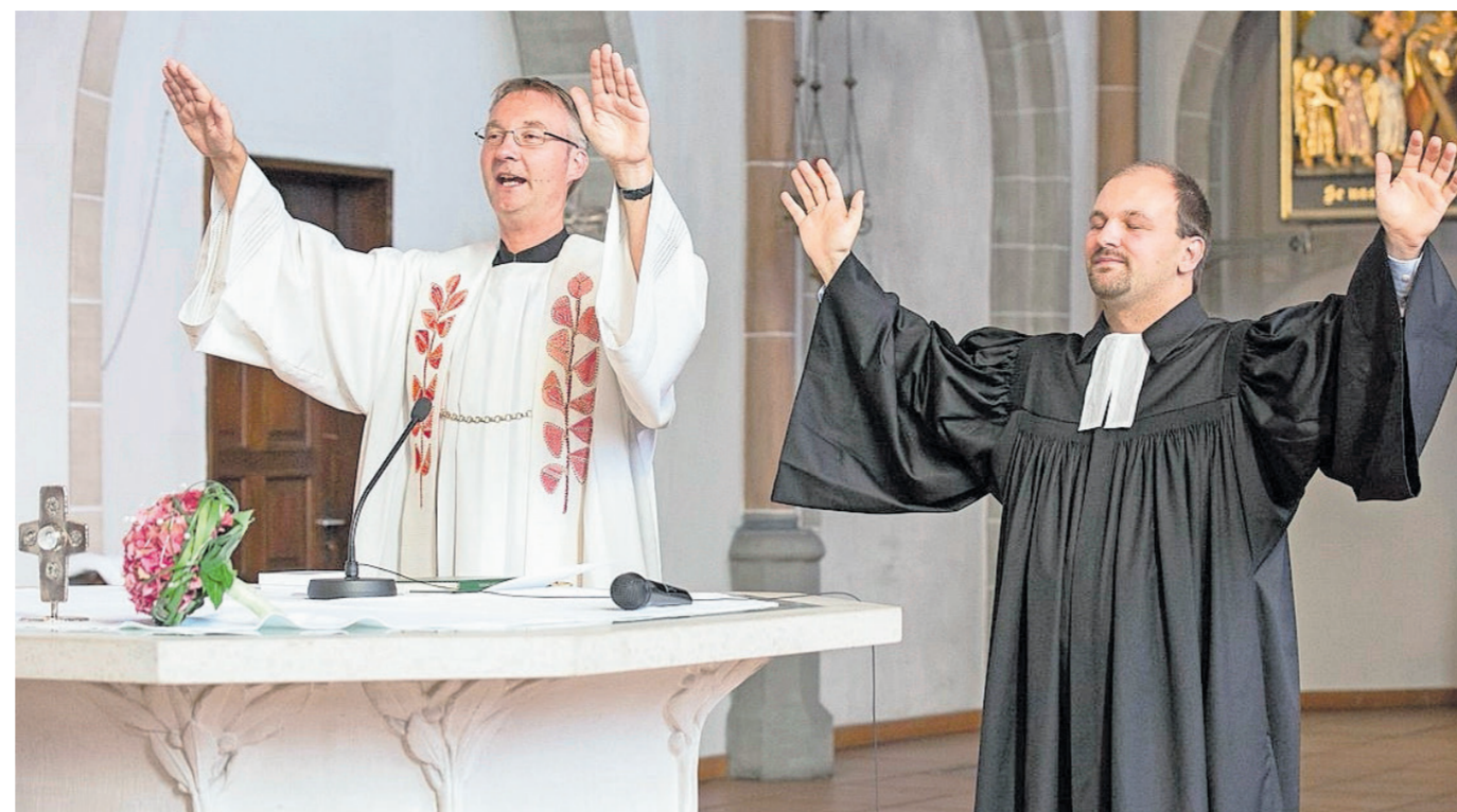
(Oben) Gemeinsamer Segen: Die Ökumene ist heute im kirchlichen Alltag selbstverständlich. (Links) Streit um den Glauben: Doktor Eck und der Basler Reformator Johannes Oekolampad im Wortgefecht an der Badener Disputation vor 500 Jahren.

Die Disputation verhinderte die Eskalation nicht dauerhaft. Im Gegenteil, sie bildete den Auftakt zu den Religionskriegen. Die Kriege von Kappel folgten 1529 und 1531. Zwinglis Tod auf dem Schlachtfeld besiegelte die militärische Niederlage Zürichs. Doch die Spannungen blieben und entluden sich 1656 und 1712 in den zwei Villmergerkriegen. Die Parteien blieben weiterhin unversöhnlich. 1847 trafen sich Reformierte und Katholiken abermals auf dem Schlachtfeld im Sonderbundkrieg. Die liberalen Reformierten dominierten unter General Henri Dufour, der seinen Truppen befahl, «nach humanitären Grundsätzen» zu verfahren. Doch die Gräben zwischen Katholiken und Reformierten blieben in der Bevölkerung noch lange. «Noch bis hin in die 1970er-Jahre war eine Ehe zwischen Katholiken und Reformierten verpönt», sagt Wiederkehr. «Die heutige Ökumene ist eine Errungenschaft des 20. Jahrhunderts.»